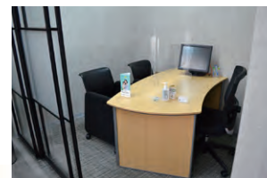
社内の環境整備に努めています