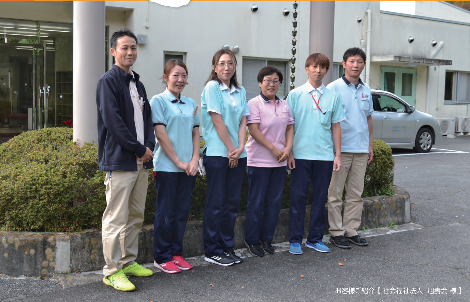
お客様ご紹介【社会福祉法人 旭壽会 様】