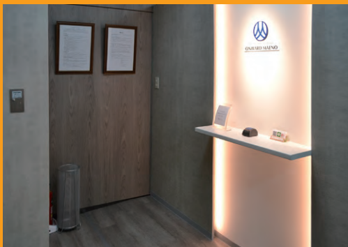
オンワード・マエノのエントランスが新しくなりました