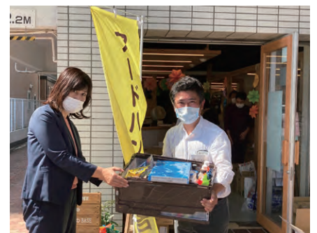
フードバンクへの譲渡です